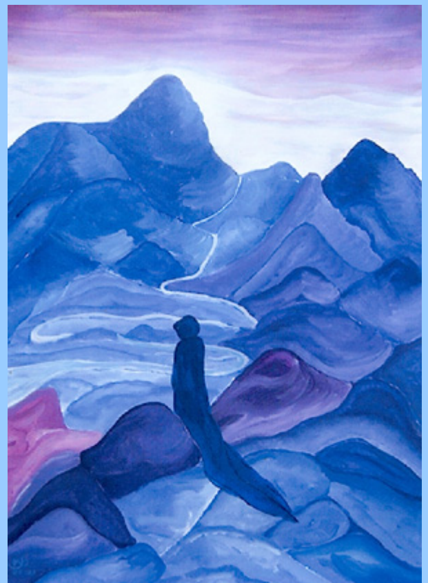
Rouwlandschap 2 – Anne Plokkaar

Reflectie op eigen (werk)ervaringen in verslagen en als inbreng in de cursusdag.